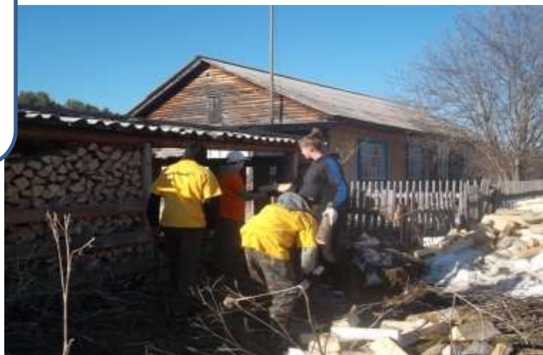
Укладка дров односельчанам