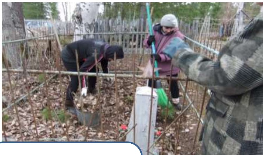
Уборка могил участников ВОВ, умерших от ран