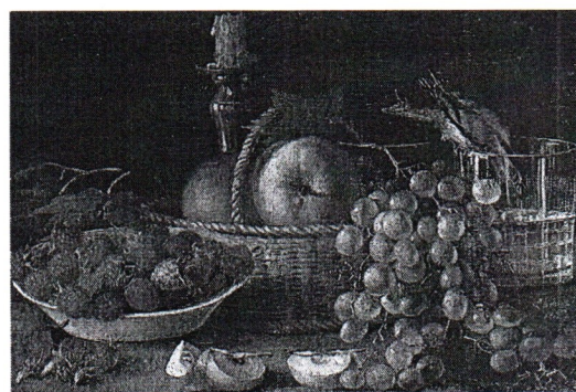
И.Ф.Хруцкий, «Плоды и птичка» (1833)

Ученики дают различные ответы, что изображение нарисовано более объемно и т.п. Учитель задает следующий вопрос: Как вы думаете, являются ли синонимами понятия «трехмерное изображение» и «3D-изображение»? После изучения новой темы связанной с процессом 3D-моделирования, вопросы, которые может задать педагог для дальнейшей работы по созданию проекта могут быть такие: Подумайте, где можно использовать 3D-моделирование в нашем регионе? С какой целью? В качестве подсказки можно сказать о том, что особое всеобщее внимание в настоящее время уделяется проблеме сохранения истории деревянного зодчества Томска, необходимости сохранения информации об утраченном, а также демонстрация красоты сохраненного зодчества. Возможно ли это сделать при помощи современного высокотехнологичного оборудования или 3D-моделирования и как?